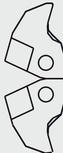
Verktygsskär TA4 A

SE HELA VÅRT PRODUKTPROGRAM – WWW.LINDOVA.SE